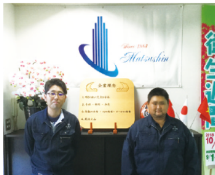
先輩社員とともに

みんなで協力しながら課題に取り組んだことが、今では楽しかった思い出です。「ものづくりは未来の日本づくりにつながる」という基本姿勢で、前向きに仕事に取り組んでいます。訓練校での学びが、今後の目標や方向性に広がりを持たせてくれました。目指す将来像は「トータルな建設を担えるメンバーになる」です。これからも努力します。